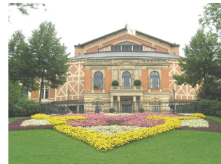
Festspielhaus am Grünen Hügel

Die Stadt Bayreuth wird meist mit dem weltberühmten Wagner-Festspielen in Verbindung gebracht. Darüber hinaus bietet Bayreuth einen schönen historischen Stadtkern, zahlreiche Parks und Schlösser sowie ein umfangreiches Kneipen- und Restaurantangebot.